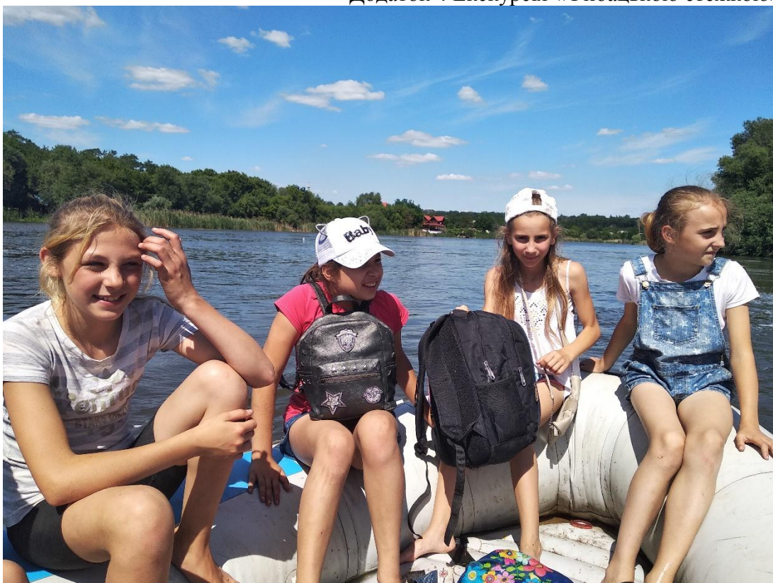
Додаток 5 Тур вихідного дня до острова