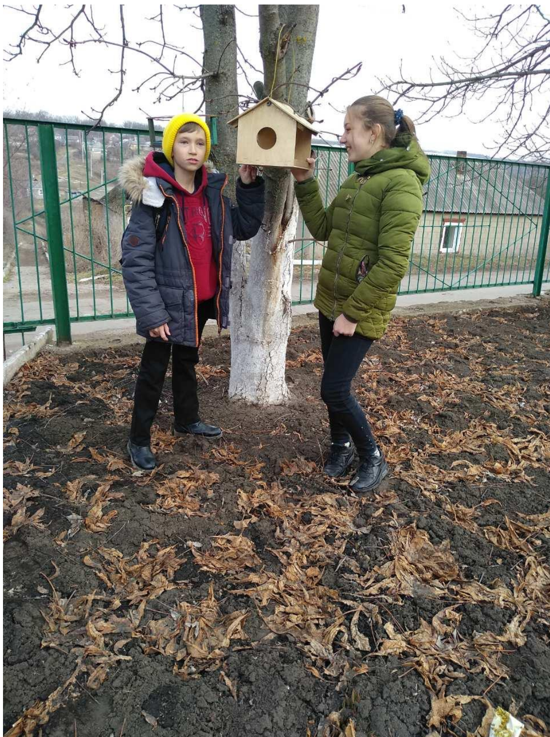
Додаток 1 Благодійна акція « Нагодуй пташеня»