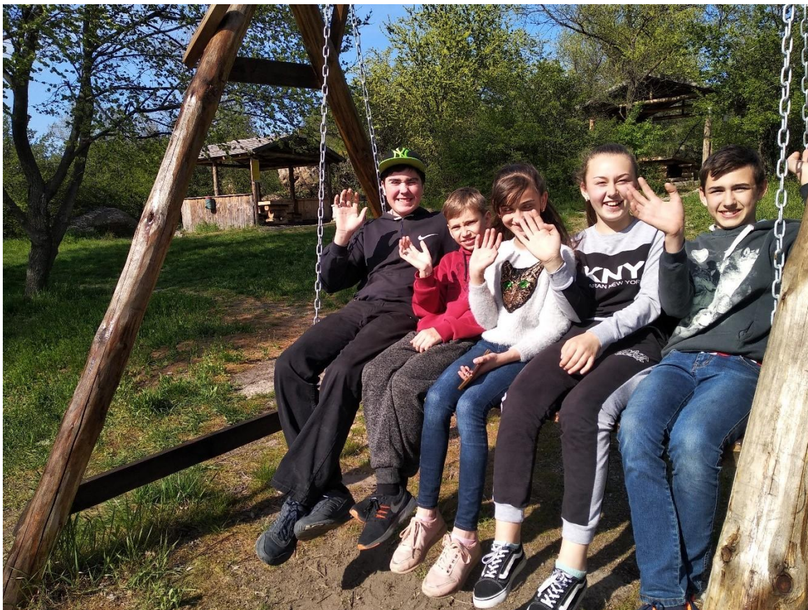
Додаток 4 Експурсія « Рибачькою стежкой»