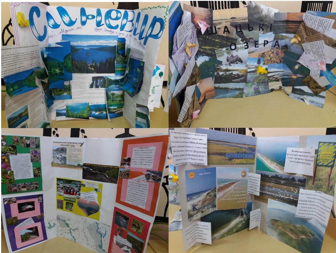
Додаток 6 (до Міжнародного дня туризму)