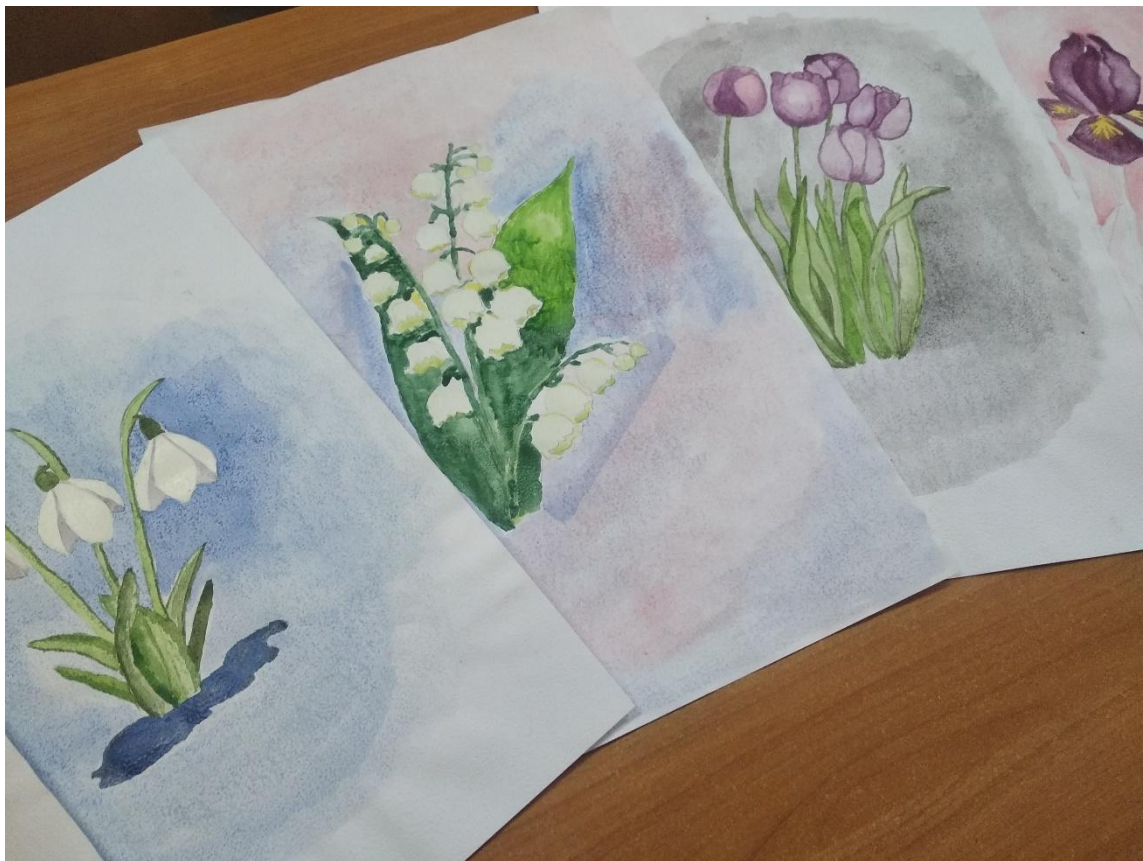
Додаток 2 Робота з гуртківцями «Добродії»